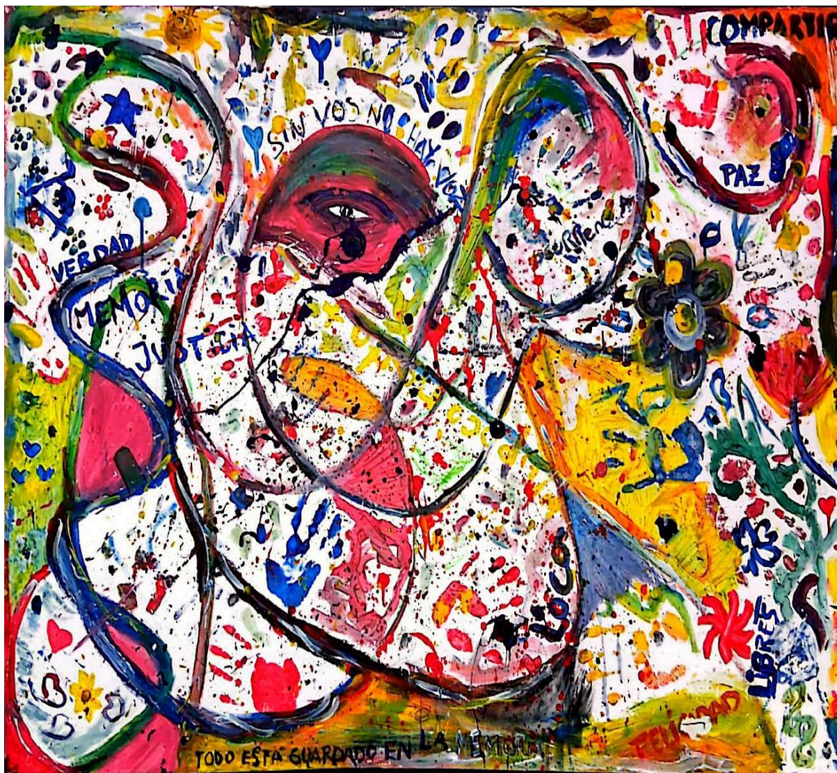
Miscelánea colectiva en conmemoración del espacio Centro Diurno Pando.