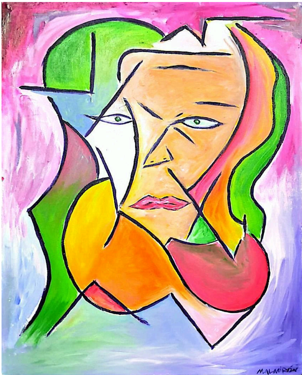
La chica expectante